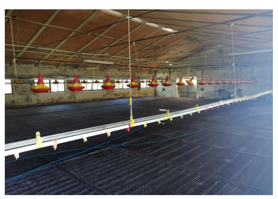
Imagine 2: Check of the empty houses.

Cleaning and disinfection procedures are evaluated